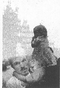
Estados Unidos, lo que se ha dado en llamar "la sociedad de la destrucción".

Si bien nadie se alegra por la muerte de miles de inocentes en los ataques del 11 de septiembre, no se puede negar que en muchos conciencias cupo la idea de que ese es el resultado de tal política intervencionista, aquella que tan buenos resultados le había dado hasta entonces a los gobiernos de la Unión Americana.