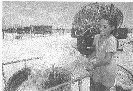
Mientras continúa el tira y afloja entre el Municipio y el Gobierno del Estado, persiste el problema por el abasto de agua.

promiso que implica el estratégico adudo de la Copape en Hermosillo.