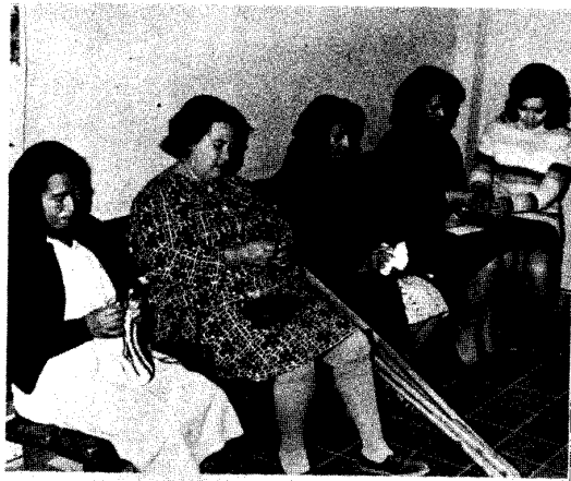
CLUB DE MADRES.