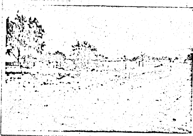
VISTA DEL EJIDO "EL SANEAL"