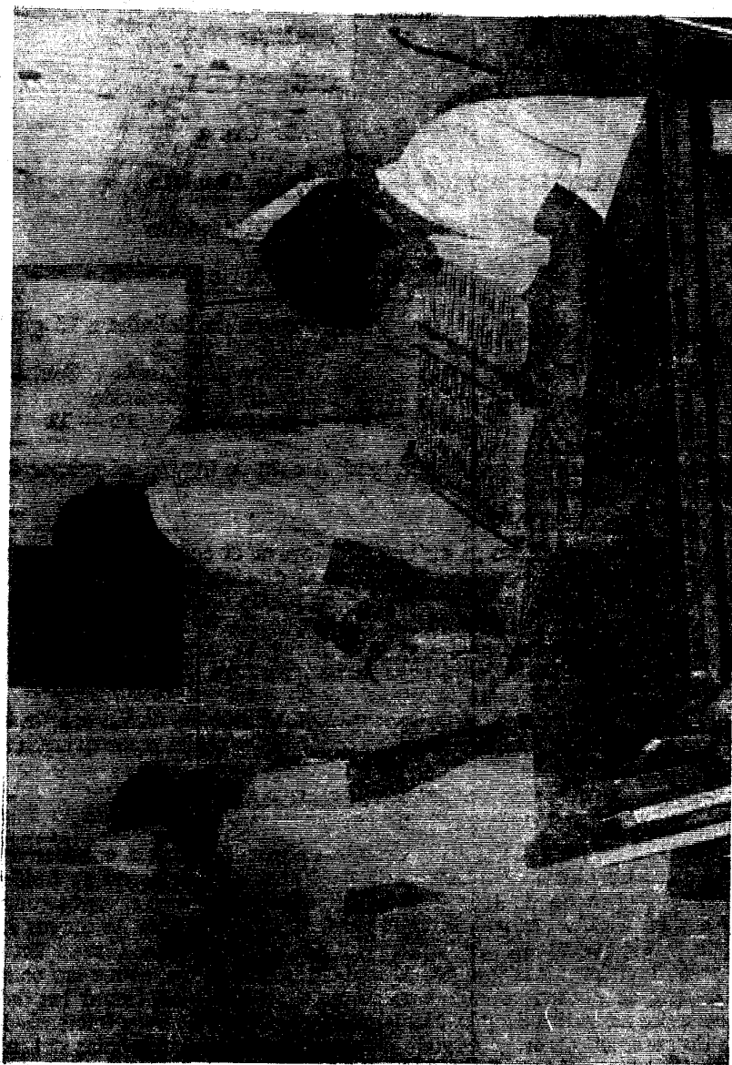
LA ENFERMERA ELABORANDO EL LIBRO DE REPORTE