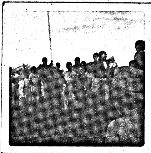
DIA DEL NIÑO.