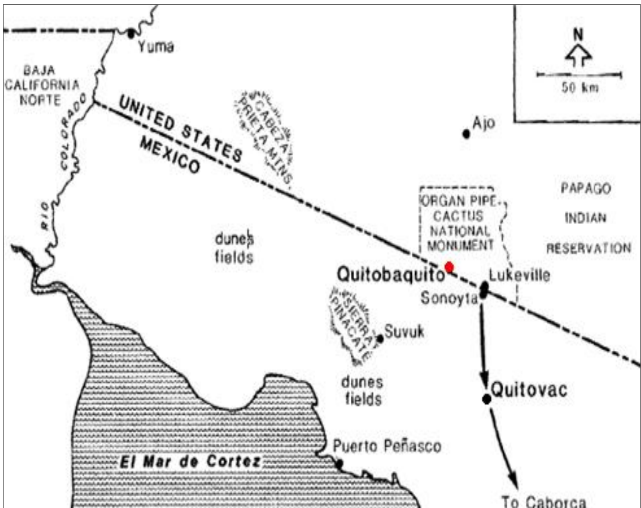
Mapa 4. Quitovac en relación con Quitobaquito en el estado de Arizona. Gary P. Nabhan; Pápagos Influences on Habitat and Biotic Diversity: Quitovac Oasis Ethnoecology . 1982. p.125.

Quitovac se dividió en 1853 con la venta de La Mesilla quedando gran parte en territorio extranjero, ahora se encuentra como área natural protegida llamado “Quitobaquito” en el estado de Arizona, Estados Unidos (ver mapa 4), lo que ocasionó que también se dividiera la etnia indígena pápago.