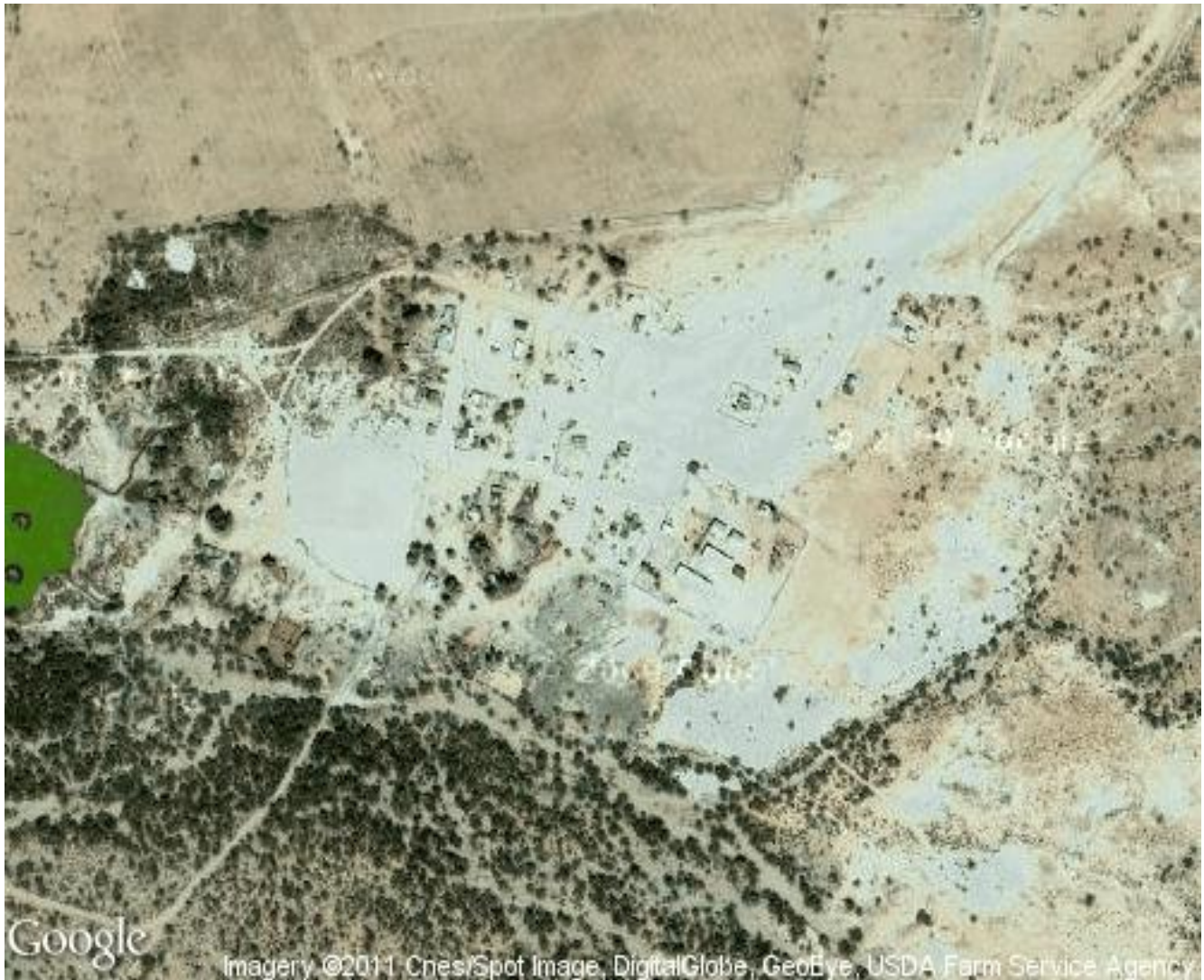
Mapa 3. Territorio Quitovac.

Quitovac está ubicado en una zona desértica y su clima es muy cálido. Se registra una temperatura más alta que llega a los 47°C durante los meses de julio y agosto y en diciembre y enero la temperatura baja a los 15°C.