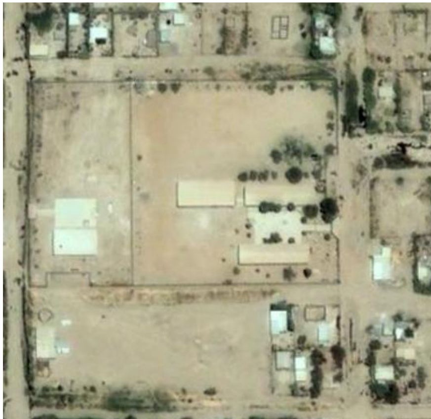
Ubicación escuela primaria 19 de Abril

En el salón de clase, se encuentran disponibles 30 mesabancos individuales de madera reconstruidos, un escritorio con una silla para la maestra, dos estantes, donde se guarda material didáctico y las cajas con los materiales recortables del rincón de las matemáticas. Existen dos pizarras,