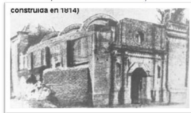
Imagen 1.18 : Templo San Antonio.

Arquitectura Pre - Renacentista Arquitectura Renacentista y barroca