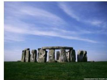
Imagen 1.1 : Stonehenge

ARQUITECTURA CONTEMPORÁNEA EMBLEMÁTICA HERMOSILLO, SON.