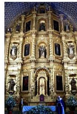
Imagen 1.112: Ex convento de Santo Domingo. Oaxaca

Arquitectura Pre-Renacentista Arquitectura Renacentista (Barroca, Rococó y Churrigueresca)