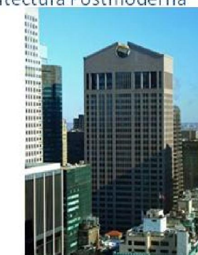
Imagen 1.7 : Edificio ET&T E.U.A.

NOTA: Cabe aclarar que aunque se presentan algunas fechas, éstas no deben ser vistas como principio o fin inamovibles. En cualquier expresión, lo pasado no se da de repente como tampoco la aparición de lo nuevo.