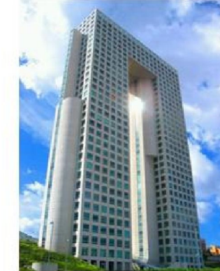
Imagen 1.11 : Corporativo Arcos. Distrito Federal