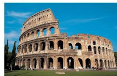
Imagen 1.5 : Coliseo Romano Italia