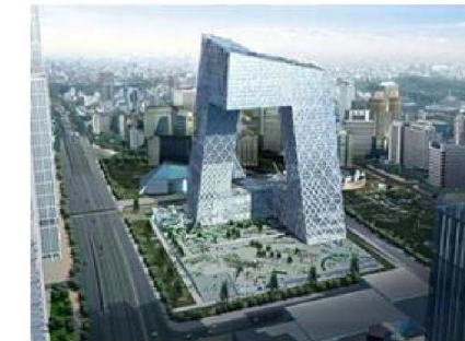
Imagen 1.4. Sede Televisión Estatal China