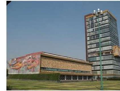
Imagen 1.10 : Ciudad Universitaria UNAM. Distrito Federal