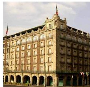
Imagen 1.13 : Hotel Majestic. Distrito Federal

Arquitectura Neo colonial Arquitectura Neo indigenista Arquitectura Art Deco