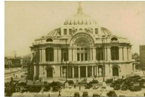
Imagen 1.9 : Palacio de Bellas Artes. Distrito Federal