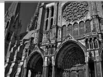
Imagen 1.2 : Catedral de Chartres Francia