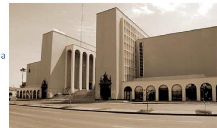
Imagen 1.19 : Museo Biblioteca Universidad de Sonora

Arquitectura Neo colonial Arquitectura Funcionalista Arquitectura Art Deco Arquitectura Colonial Californiana