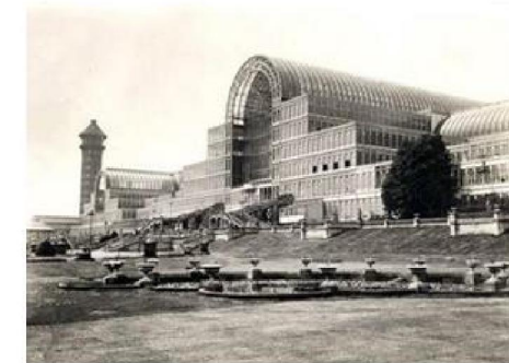
Imagen 1.3 : Exposición Universal de Londres