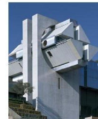
Imagen 1.14 : Casa del aire. Distrito Federal

Arquitectura Moderna Internacional Arquitectura del Regionalismo Crítico Arquitectura Posmoderna