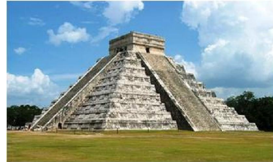
Imagen 1.8 : Chichen-itza. Yucatán

ARQUITECTURA CONTEMPORÁNEA EMBLEMÁTICA HERMOSILLO, SON.