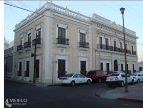
Imagen 1.16 : Casa Hoeffler