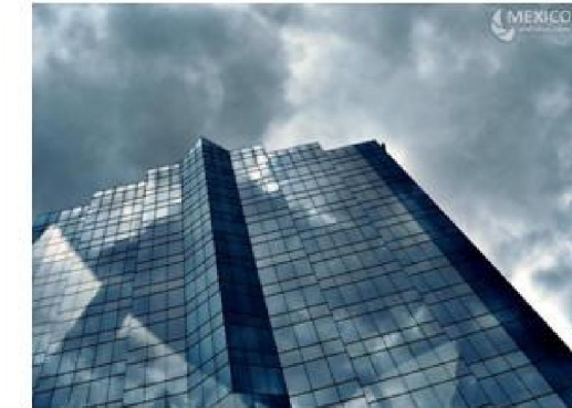
Imagen 1.17 : Torre de Hermosillo