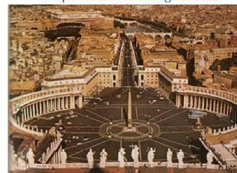
Imagen 1.6. Plaza de San Pedro Italia