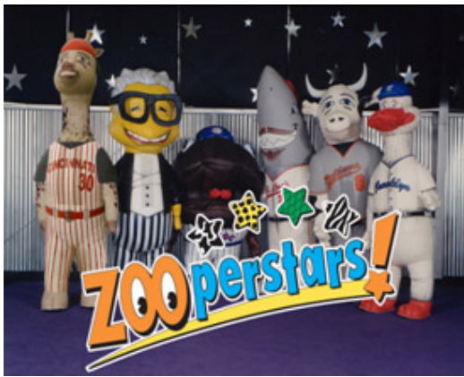
En este 2007, los Zooperstars estarán visitando Hermosillo por sexta ocasión

Además de las promociones institucionales se promovieron los espectáculos que se realizan en los estadios de ligas menores en Estados Unidos para que se hicieran en el Héctor Espino, como los Zooperstars y Bird Zerk. También estuvieron las porristas de los Cardenales, equipo de fútbol americano de Arizona.