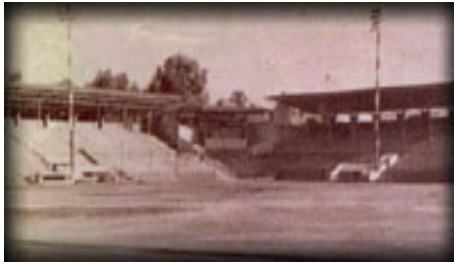
Estadio Fernando M. Ortiz

que al pensar en dejar el estadio “Fernando M. Ortiz”, los Naranjeros de Hermosillo le rindieran un homenaje al hombre que los llevó a la conquista de múltiples títulos. Por ello el 4 de octubre de 1972 se inauguró el estadio “Héctor Espino” situado al Poniente de Hermosillo y con capacidad para 12 mil aficionados.