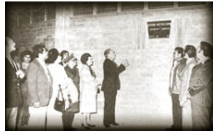
Inauguración estadio Héctor Espino