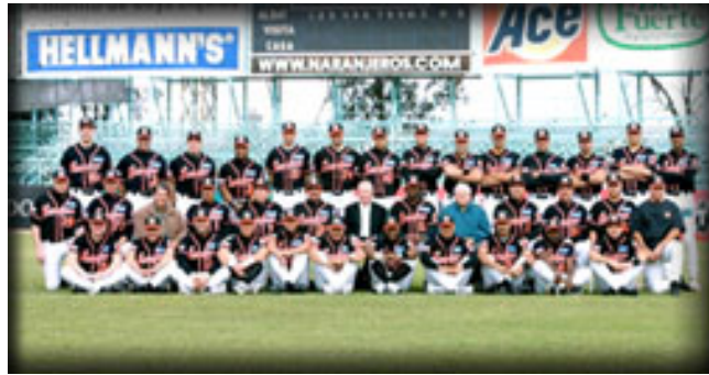
Equipo ganador de la Temp. 2000-2001