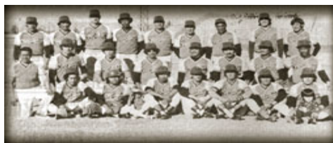
Equipo ganador de la Serie del Caribe de