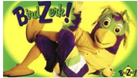
BirdZerk el pajarito travieso visitó el Héctor Espino

Debido a que el Plan de Trabajo de la Dirección de Relaciones Públicas de Naranjeros de Hermosillo de la temporada 2006-07 se encuentra en otro formato distinto al de la redacción de esta investigación, se ha colocado como anexo 1. En el anexo 2 se encontrará una gráfica que muestra la asistencia promedio durante las últimas 5 temporadas en el estadio Héctor Espino.