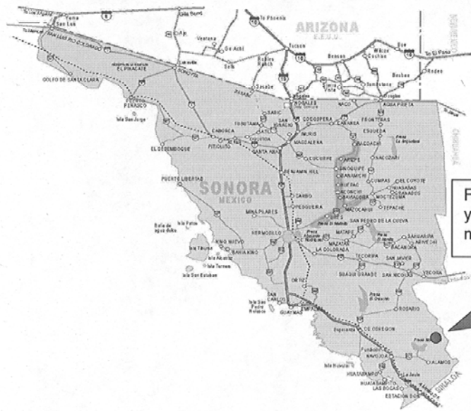
Fig. 2.1 Localización del deposito de yeso en el ejido "El Taymuco" municipio de Alamos, Sonora